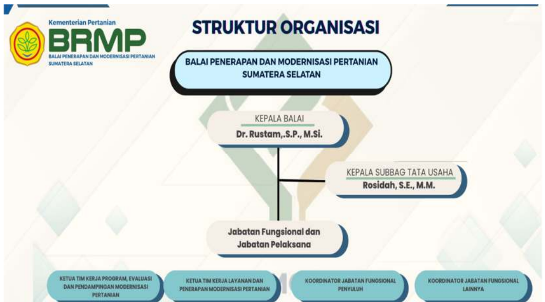
Gambar 1. Struktur Organisasi BRMP Sumatera Selatan

Tim Kerja Program dan Evaluasi mempunyai tugas membantu Kepala Balai dalam menyusun rencana kegiatan, program dan anggaran, evaluasi dan pelaporan, pelaksanaan pengumpulan dan pengelolaan data dan informasi, serta inventarisasi dan identifikasi kebutuhan teknologi spesifik lokasi dan Standar Nasional Indonesia.