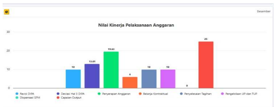
Gambar 3. IKPA BRMP Sumatera Selatan Tahun 2025 pada Aplikasi SMART.

IKPA BRMP Sumatera Selatan hingga 31 Desember 2025 mencapai 102,89% dari target 91 dengan capaian kinerja 93,63, dengan rincian sebagai berikut: (1) Revisi DIPA sebesar 100, (2) Deviasi Halaman III DIPA sebesar 86,71, (3) Penyerapan anggaran sebesar 98,17 (4) Belanja Kontraktual sebesar 60, (5) Penyelesaian Tagihan sebesar 100, (6) Pengelolaan UP dan TUP sebesar 100, (7) Capaian Output sebesar 100 dan (8) Dispensasi SPM sebesar 0. Capaian IKPA dapat dilihat pada Gambar 3.